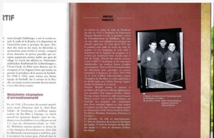
L'équipe de tennis de table 1966