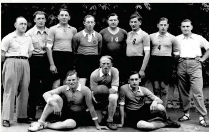
L'équipe de basket 1937-38

Ce n'est qu'en automne 1940, sous l'occupation allemande, que la section de football vit le jour.