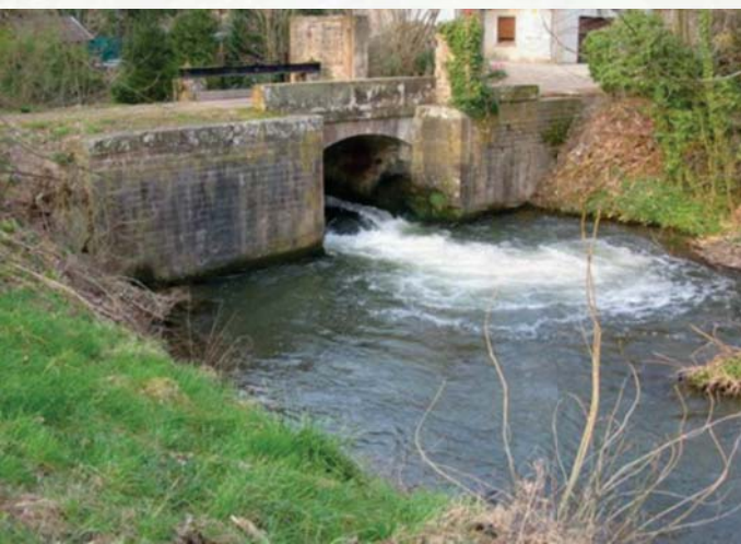
Le canal naît officiellement à la chute sise Impasse de la Mossig à Wolxheim

En serviteurs zélés, VAUBAN et TARRADE avaient exécuté la volonté du Roi en à peine dix mois. La main d'œuvre été constituée de soldats, de prisonniers et de paysans réquisitionnés. Nul doute que les habitants de notre village ont été mis à contribution.